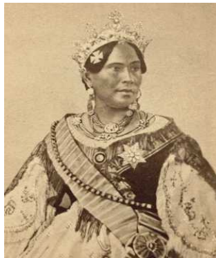
La reine Rasoaherina (1863-1868)

Lorsque la reine Rasoaherina lui succéda, elle raffermir l'interdiction par les lois du royaume d'aliéner la terre aux étrangers. Cela existait bien depuis avant le roi Andrianampoinimerina. Et jusqu'ici aucun président malgache (Tsiranana, Ratsiraka, Zafy) n'avaient osé transgresser ces lois. Même au nom de la pauvreté extrême du peuple malgache. Pas plus que de remblayer la zone tampon située sur la route digue pour y ériger une « ferme-pilote », avec la bénédiction du système des Nations Unies. Mais c'est une autre histoire...